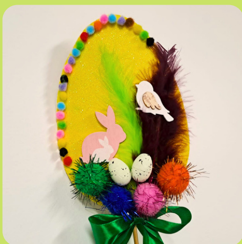
pisanka na patyku